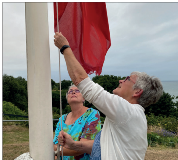
Flaget skal til tops hver morgen. Ofte er det kursisterne selv, der tager den skønne tjans.